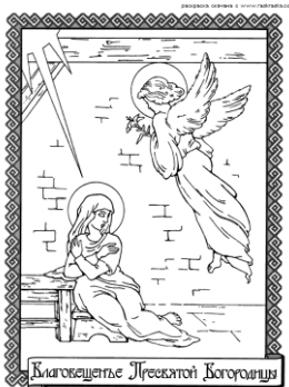
«Ангел, явив к Мне, сказал: радуйся! Благовещает Господь с Тобою. Благословен Ты между женами! Не бойся, Мария, ибо Ты обрече благодыть у Бога, и вот, родиши Сына, нарекуемаго Единородным Иисусом» (Евангелие от Луки 1:26, 30-31)

(Празднуется 25 марта. Но мы, в этом году проводим богослужение, посвященное этому торжеству в среду 26 марта)