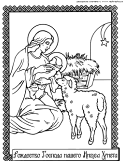
«Истинно время родить Его, и родила Сына своего Первенца, и сложила Его, и положила Его во ясли, потому что не было им места в гостинице» (Евангелие от Луки 2:6-7).

Когда Господь является Израильянину по имени Маной, отцу Самсона, то реакция Маноя для нас кажется необычной. Он зовет свою жену и с унынием говорит ей: «... верно мы умрем, ибо видели мы Бога» (Суд.13:22). Увидели Бога и готовятся к смерти. Вот такое отношение... Или вспомните реакцию пророка Исаии, который в Иерусалимском Храме также пережил встречу с