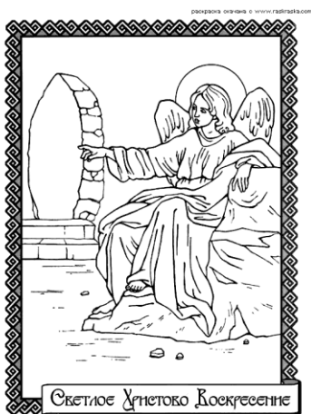
«Его нет здесь. Он воскрес!» - этими словами встретил Ангел Господень жен-мироносиц, пришедших рано утром ко гробу, где лежало тело Иисуса.

смертью и избавления душ, с верою ожидавших Его пришествия, и введение благоразумного разбойника в рай.