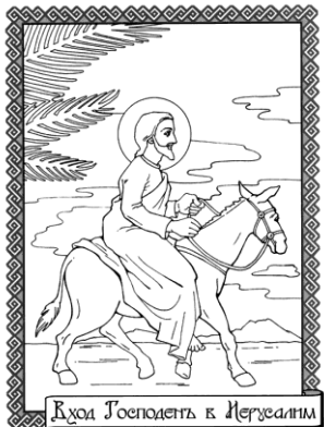
Вход Господень в Иерусалим

За неделю до Светлой Пасхи Страдания Иисуса торжественно вывели в Иерусалим на ослике и осле. «И предшествовали и сопровождавшие Иисуса: осанной благословен Грядущий во имя Господне! Осанна в вышних!» (Евангелие от Марка 11:9-10).