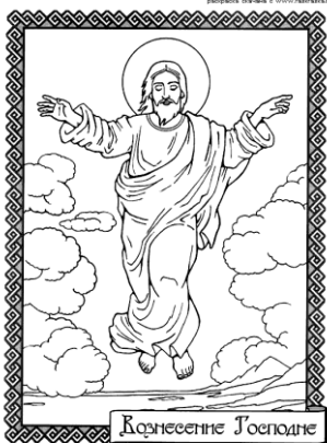
На сороковой день после Святого славного Воскресения Иисус вывел своих учеников в Вифанию и, подняв руки Свои, благословил их. И, когда благословил их, стал удаляться от них и возноситься на небо, и облако взяло Его от вида их» (Евангелие от Луки 24:50-51, Деяния 1:9).